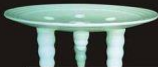
Fengzhang clear elegant atmosphere 幽静气氛 云淡风轻