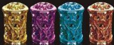
天空之城 点亮新气 Candle in the Sky P Plus the new gas