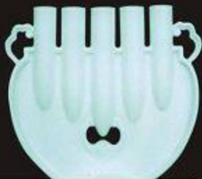
Raise the quality of life 生活品质 提升心情