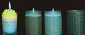
Grace bright Color like 品位璀璨 绚烂本色