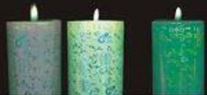
Healthy Light Love unlimited 健康之光 爱勇无限