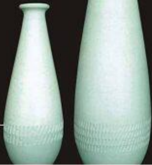
Quiet atmosphere 宁静致远 优雅非凡